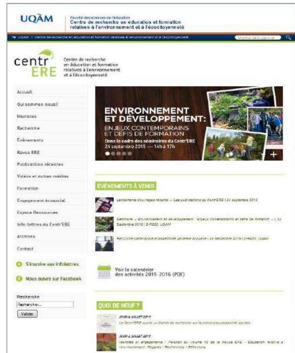
Figure 2 : Site internet du Centr'ERE

Lorsque le temps le permet, certains essais sont effectués afin de tester différentes approches du design graphique concernant les différentes représentations visuelles des événements du Centr'ERE.