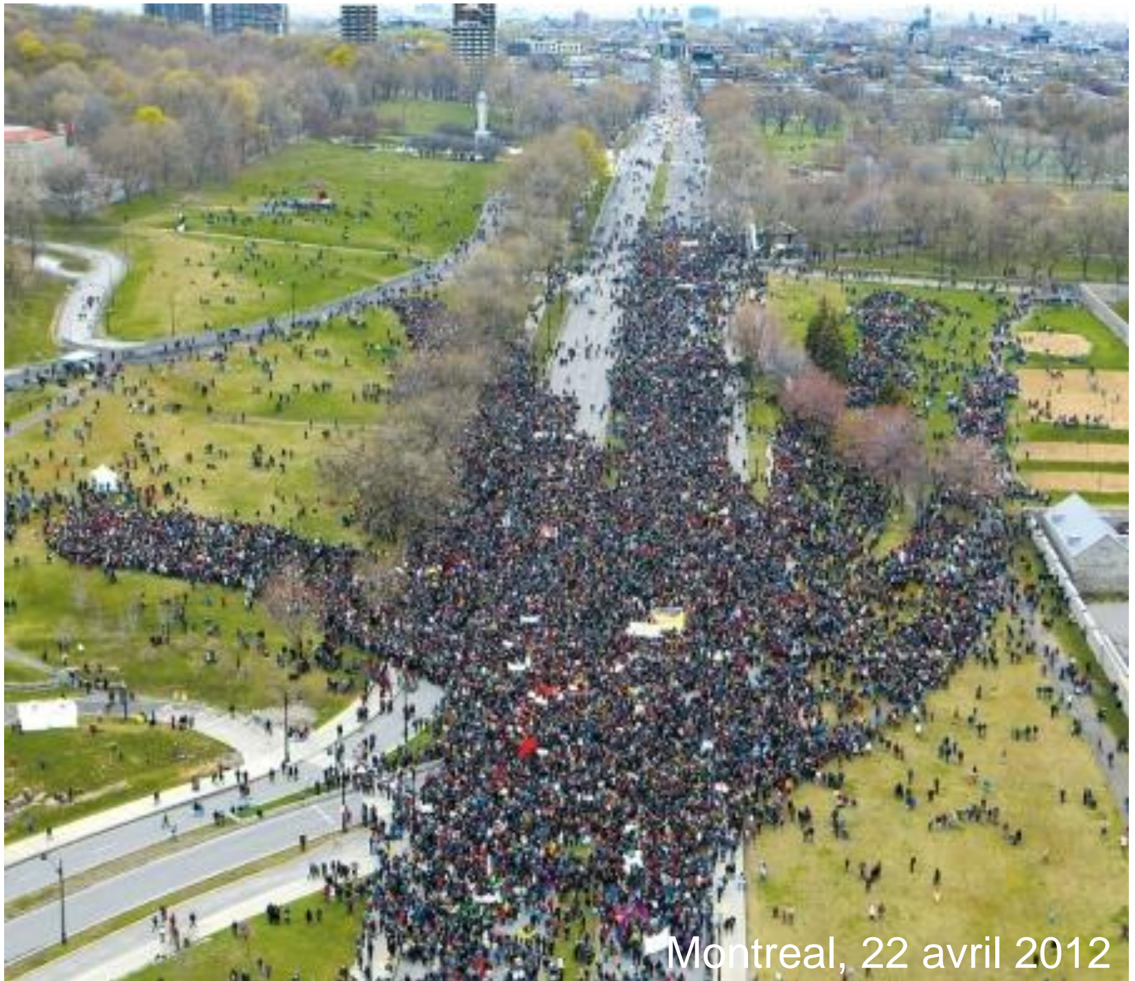
Montreal, 22 avril 2012